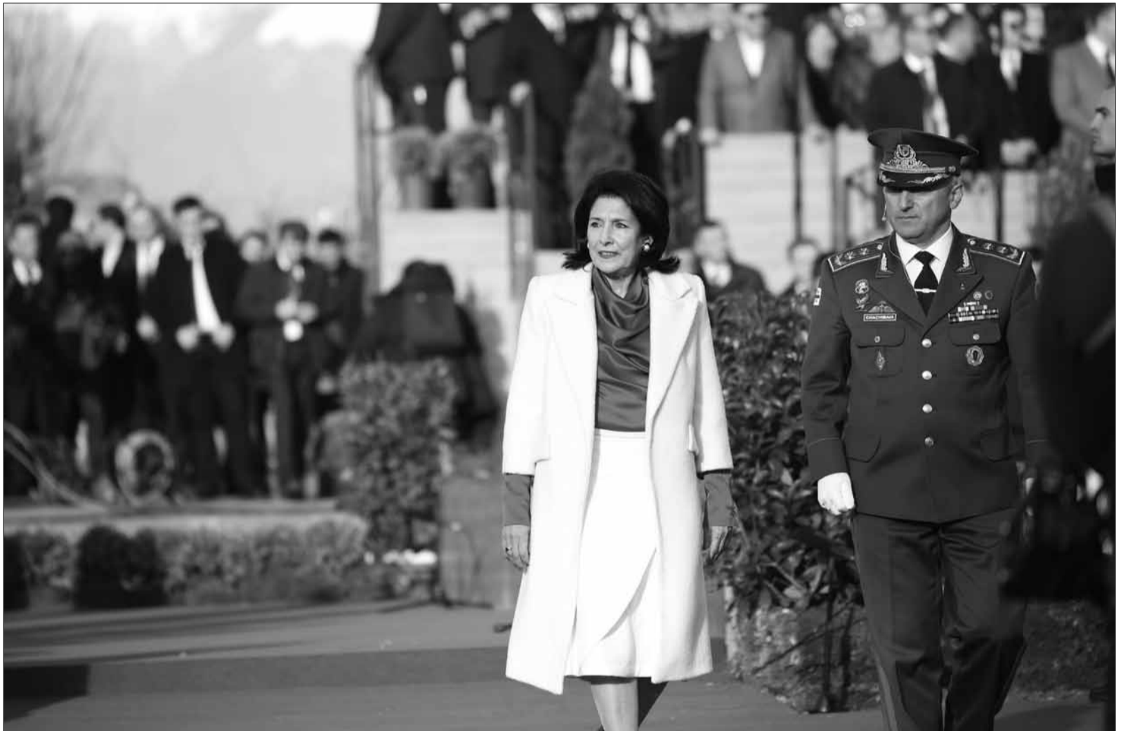
საქართველოს პრეზიდენტი სალომე ზურაბიშვილი ფიხის დაღვას შემდეგ ქართველ ჯარისკაცებს მიხსალმა

თუმცა დამოუკიდებლობის აღდგენით დავებრუნდი ევროპული სახელმწიფოს მშენებლობას, დღეს ჩვენს წინ ისევ ვადამწვევტი ეტაპია.