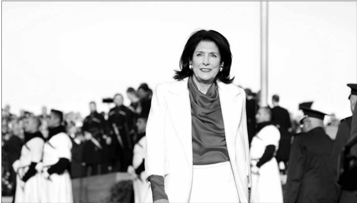
საქართველოს პრეზიდენტი სალომე ზურაბიშვილი

დღესაც, ვდგამთ პროგრესულ ნაბიჯს. ეს არის ნაბიჯი, რომელიც ვერ კიდევ გამოაკლისა მსოფლიო-